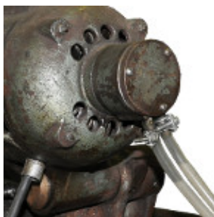
Bomba a paleta

La antigua bomba a paleta equipó a las cortadoras Carta & Malesani y las primeras Hugo Malesani. Si bien su funcionamiento es correcto, requiere mucha atención de mantenimiento. Finalmente, luego de muchos años, el conjunto toma holgura y deja de funcionar. Por eso fue reemplazado por un robusto sistema de bomba a diafragma, que equipa a las cortadoras nuevas desde 1990 y se coloca en reparaciones que llegan a nuestro taller.