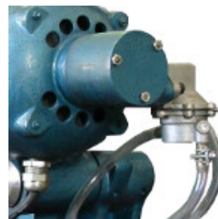
Bomba a diafragma

Antiguamente sólo se podía actualizar la bomba en nuestro taller porque eran requeridos el desarme de la máquina y modificación de eje de motor.